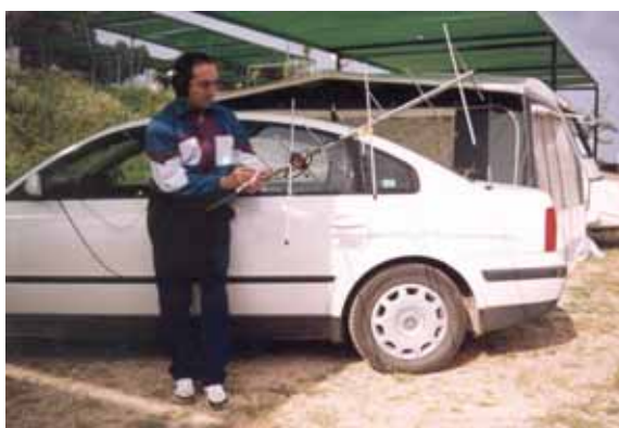
Foto 2: EA4CYQ trabajando con emisora de coche y antena ARROW de fabricación casera

Entonces me acordé de otro tipo de antenas que diseñó nuestro colega Jerry K5OE. Partió de una antena comercial que fabrica la casa M2 que se denomina Eggbeater, la cual es omnidireccional y consta de dos loops enfatizados para conseguir