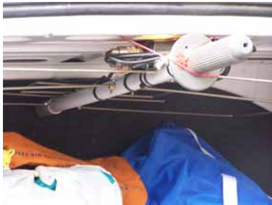
Foto 9: Antena guardada, fijada en el techo del maletero del coche

Podéis ver la antena en manos de mis sobrinas que amablemente posaron con ella en mano (Foto 6 y Foto 7), la verdad es que en las fotos aflora más el amor de tío (por lo guapas que son), que el de padre (por haber parido la antena). El boom tiene un manguito de empalme entre las antenas de ambas bandas, que permite acortar su longitud para guardarla en el maletero (Foto 8). Y como la idea era guardarla sin que ocupara mucho espacio, podéis también observar como ha quedado acoplada al techo del maletero del coche (Foto 9).