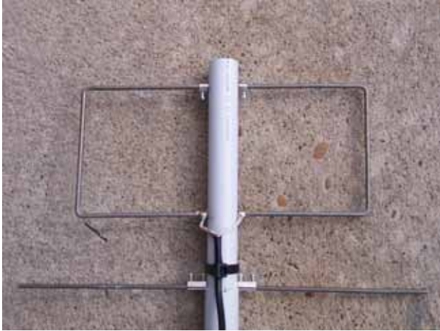
Foto 4: Detalle de fijación de los elementos al boom y conexión del coaxial al elemento radiante

Además la antena sería mucho mas sencilla eléctricamente, lo cual es un punto importante si queremos tener éxito su construcción.