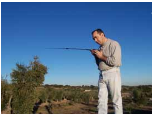
Foto 1: EA4CYQ trabajando con WT y antena omnidireccional de alta ganancia

Seguramente que con estas premisas se pueden construir varios modelos. Pero la pregunta era ¿Qué tipo de antena tiene la ganancia que una yagui en menos longitud de boom?. Bien la respuesta es las antenas cúbicas. Todos hemos leído que cuando una yagui no tiene muchos elementos, en la misma longitud de boom las cúbicas tienen mas ganancia. Pero una antena cúbica es tridimensional, por lo tanto ya no cumplimos una de las premisas a no ser que se pudieran plegar los cuadros. Este camino me pareció mecánicamente complicado.